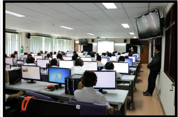
กิจกรรมที่ ๓

อบรมการใช้คู่มือการทดสอบวัดสมิทธิภาพภาษาอังกฤษ BSRU-TEP สำหรับคณาจารย์มหาวิทยาลัยราชภัฏบ้านสมเด็จเจ้าพระยา