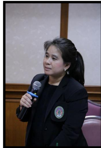
อบรมทักษะภาษาอังกฤษ (CEFR) สำหรับนิสิต นักศึกษา